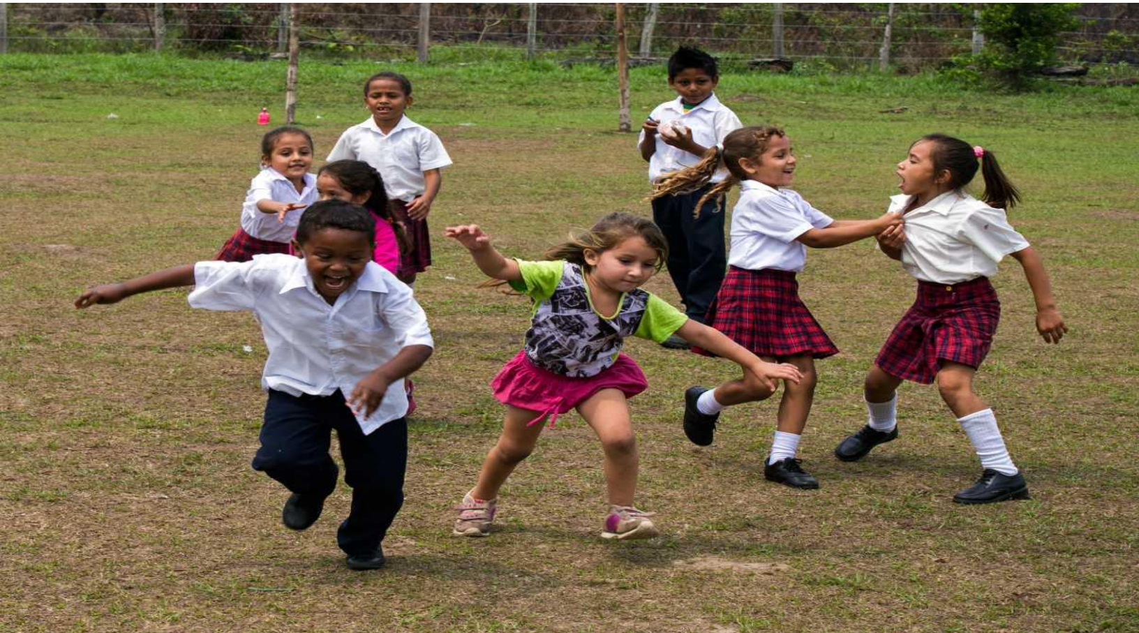
ФОТО ВНИЗУ: Дети играют на школьном дворе начальной школы, Санта-Хелена, Мета, Колумбия