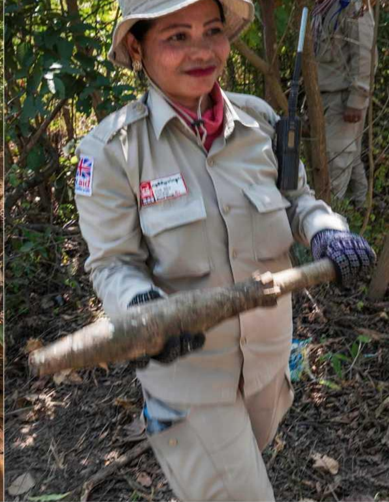
ФОТО ВВЕРХУ: Команда EOD проверяет реактивно-противотанковую гранату и минометные мины, которые эта женщина-получатель помощи из Камбоджи и ее муж нашли у себя в поле, перед их безопасным извлечением для уничтожения в другом месте.