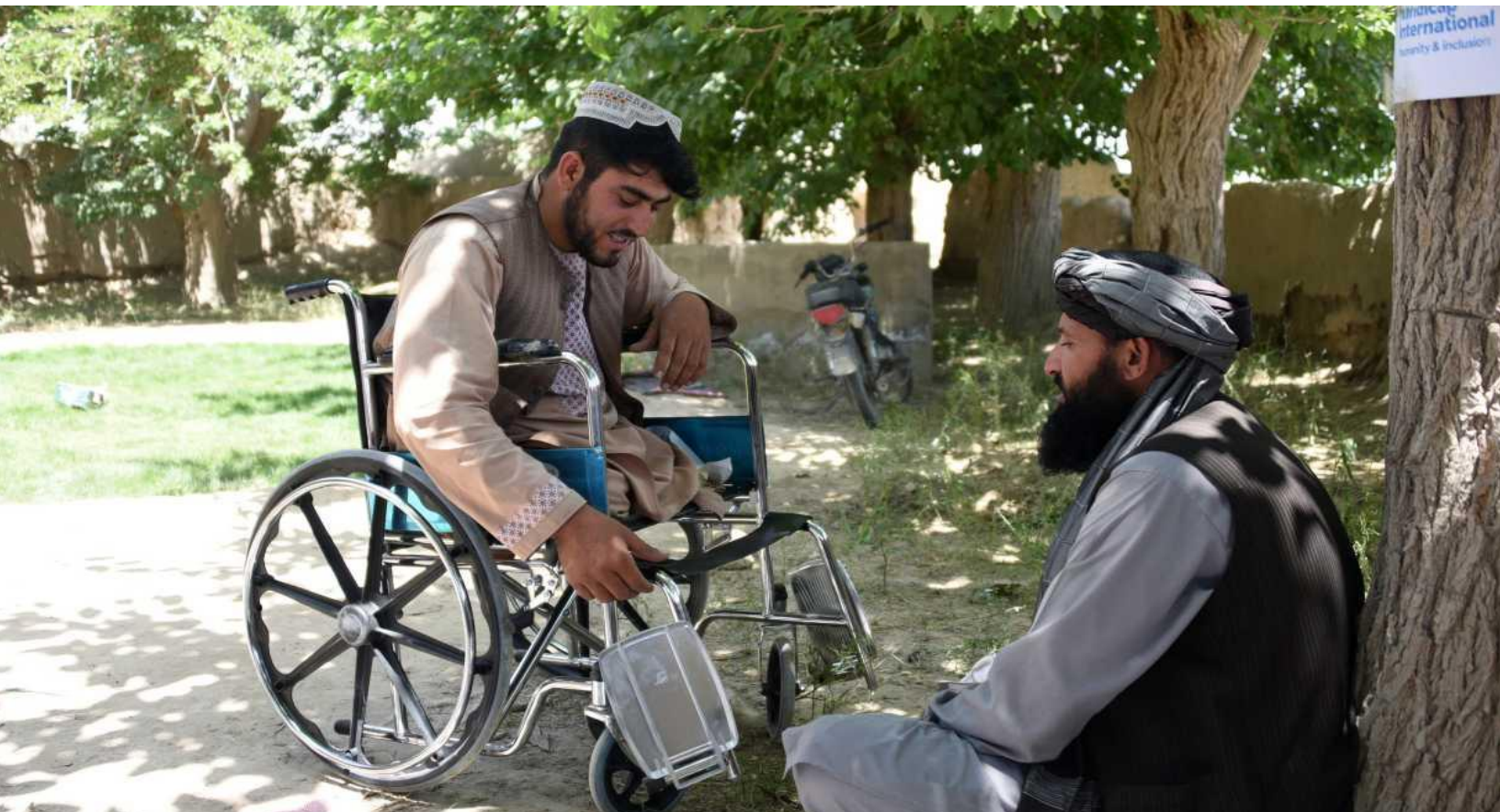
ФОТО ВНИЗУ: Этот мужчина, который получил увечье в результате несчастного случая с взрывоопасными предметами в Афганистане, получил услуги по физической реабилитации и лечение в связи с мышечной слабостью.

23 IMAS 13.10 требует, чтобы все операторы по разминированию делились с соответствующей государственной организацией данными о пострадавших и тем, что им известно о потребностях идентифицированных пострадавших и о других людях со сходными потребностями. Точно так же рекомендуется делиться такими данным с другими лицами, осуществляющими деятельность в секторах, куда относится VA, чтобы задействовать более широкую многосекторную поддержку и доноров. В данном случае может иметь место неформальное партнерство и общее предоставление информации, без ссылки на отдельных лиц, предоставляемой организации, оказывающей услуги - таким образом, лицо, осуществляющее деятельность по разминированию, не имеет средств, чтобы проверить, последовательно ли предоставляется доступ к услугам и поступают ли они к отдельным лицам, которым оказывается содействие, и, таким образом, лица, получающие помощь от этих видов деятельности, рассматриваются как непрямые получатели помощи при VA .