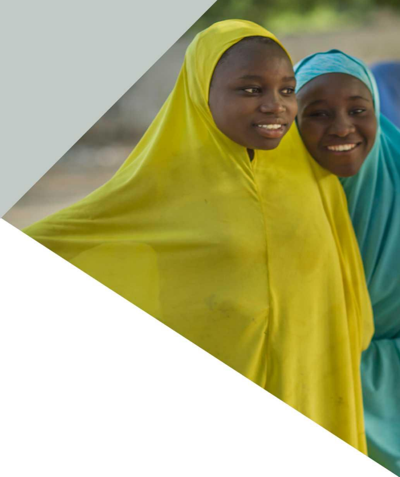
ФОТО ВВЕРХУ: Молодые женщины в селе Нгамари, Нигерия