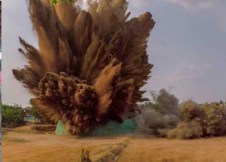
ФОТО ВВЕРХУ (по часовой стрелке от верхнего левого края): деревенские жители в Нонсомбауме, Лаос, наполняют мешки песком в качестве части защитных работ, в которых возникла необходимость, когда в поле на краю их села была найдена крупная авиабомба. Уничтожение бомбы устранило существенную угрозу для жителей села, которые теперь могут участвовать в ежедневных делах без страха.