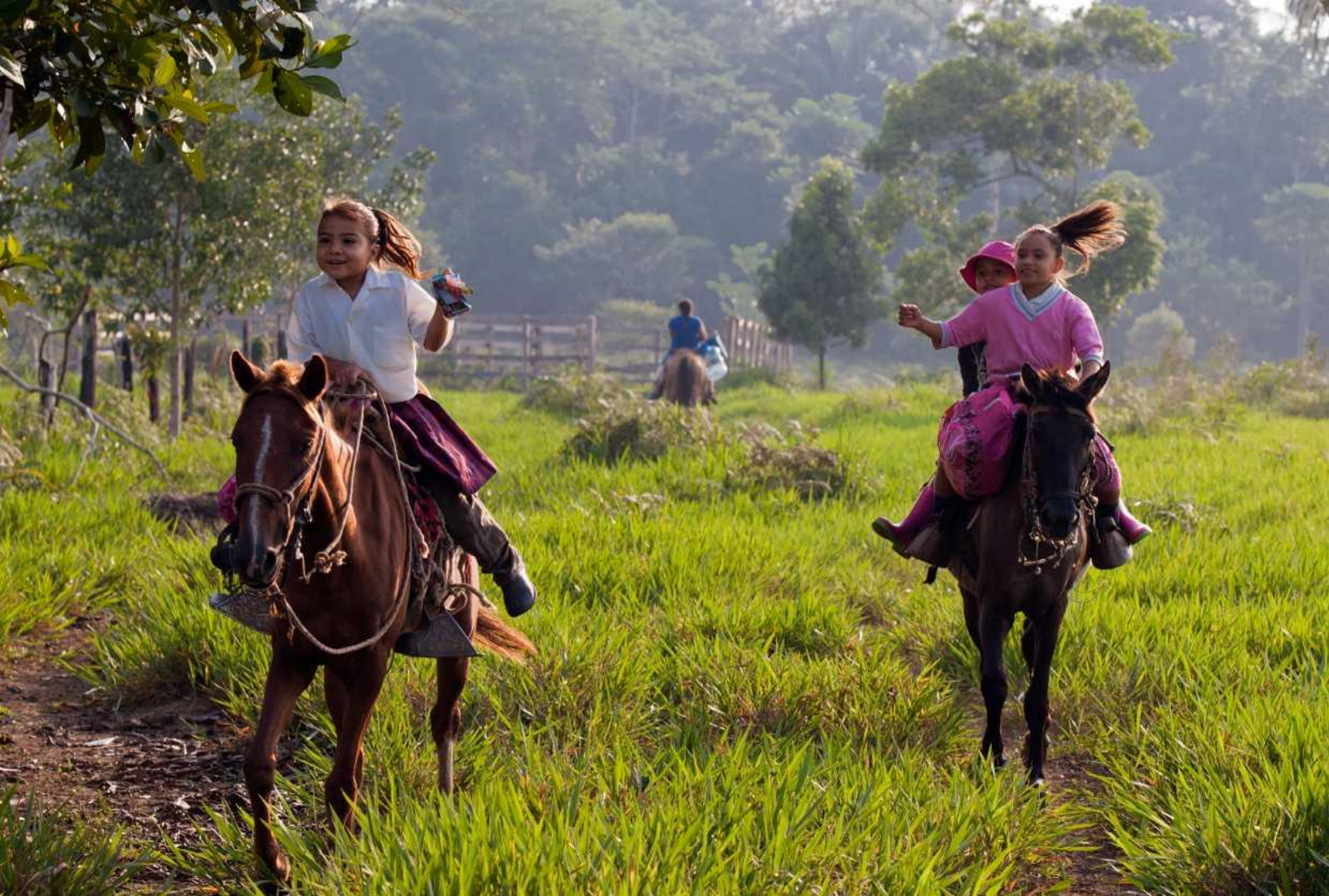
ФОТО ВВЕРХУ: Дети из начальной школы Санта-Хелена на лошадях рано утром. Некоторые из этих детей приезжают из мест, которые находятся в двух часах езды отсюда. Санта-Хелена, район Мета, Колумбия.