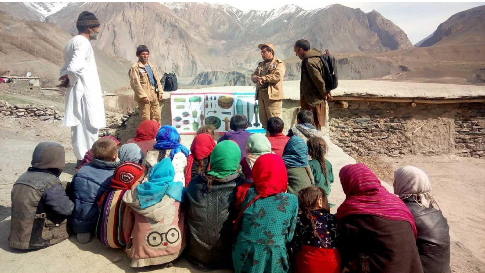
ФОТО ВВЕРХУ: гористый регион Дарваз на северо-востоке Афганистана до сих пор сильно загрязнен противопехотными минами. Эти дети из деревни Джанмарж Бала должны знать, как распознать взрывоопасные остатки войны и не подходить к ним во время игры на улице.

При описании охвата и влияния на макроуровне или в случаях, когда непосредственный сбор информации о лицах с ограниченными возможностями является закрытым или неосуществимым по иным причинам, данные можно получить из государственных или иных второстепенных источников.